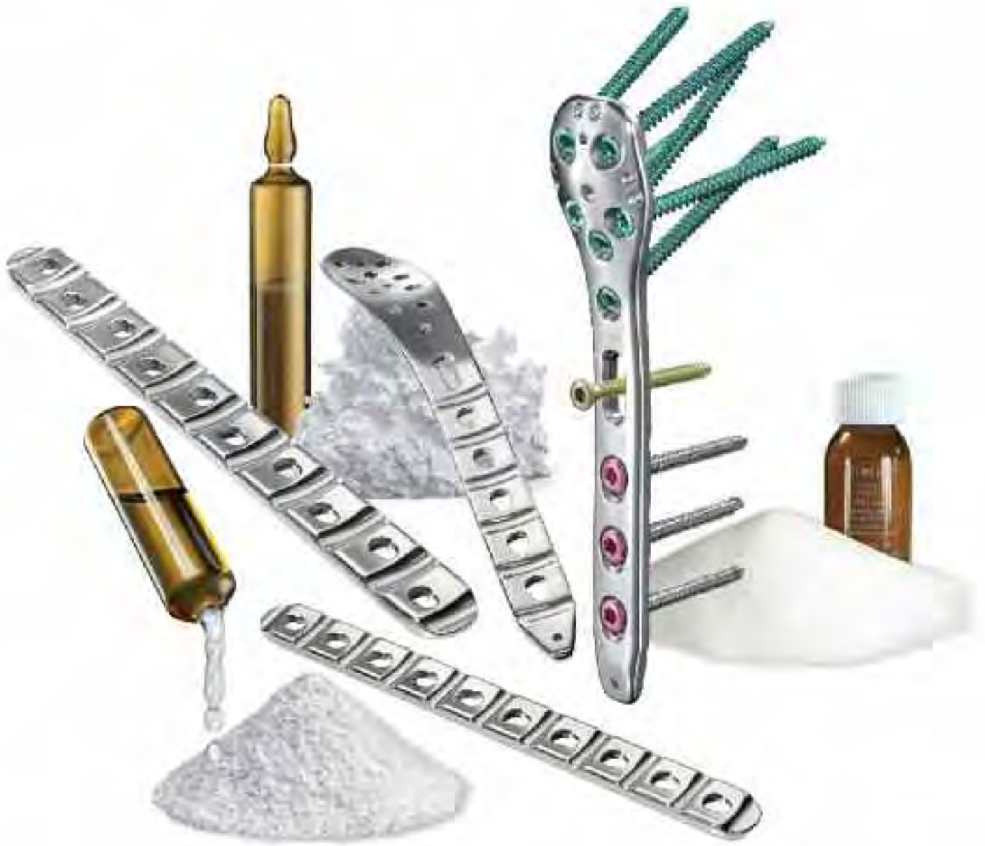
Knochenzemente und Anatomisches Plattensystem Bone Cements and Anatomical Plating System