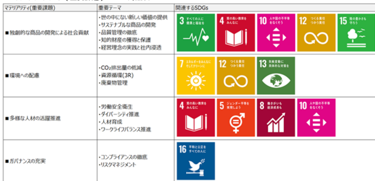
マテリアリティ（重要課題）・SDGs対照表

サステナビリティの向上を推進するにあたり、「キングジムグループ サステナビリティ基本方針」を定めております。基本方針に沿って、ESGの観点から当社の事業活動と社会課題の関連性が高い項目をマテリアリティ(重要課題)として特定し、これらに紐づく重要テーマを選定いたしました。特定したマテリアリティ(重要課題)をSDGsと関連付け、マテリアリティ(重要課題)の解決に向けた取り組みを通してSDGsの達成に貢献してまいります。