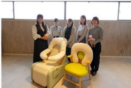
「OyaCoco」の製品と開発メンバー

また、低出生体重児のカンガルーケアに対する椅子「OyaCoco（おやここ）」を開発し、第33回日本新生児看護学会・学術集会（2024年11月）にて展示。主に病院向けに販売を開始しております。