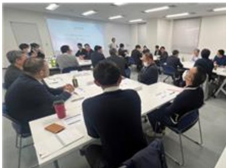
女性の健康課題に関する社内セミナーの様子

また、女性の健康に関する課題をテクノロジーで解決するフェムテックの活動を2024年より社内外に対して積極的に行っており、働く女性への理解促進を図っております。