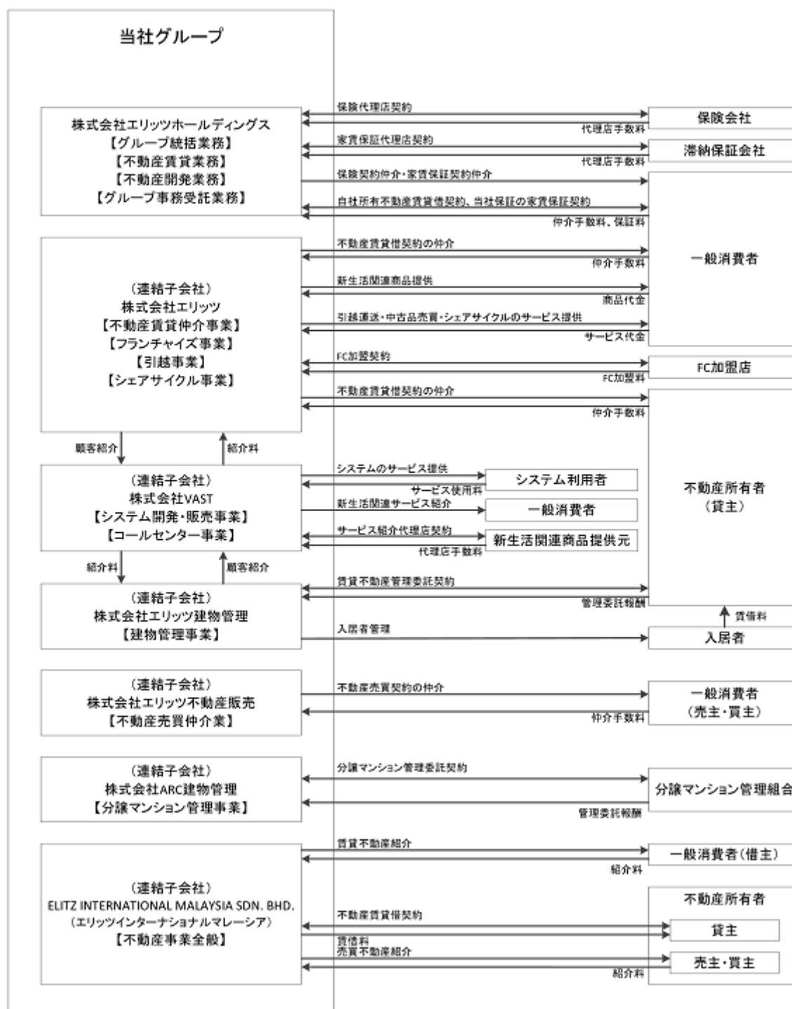
エリッツホールディングスグループ 事業系統図