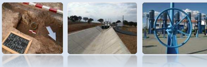
Quadro 3 - Programas de Monitorização da Rede Secundária de Rega