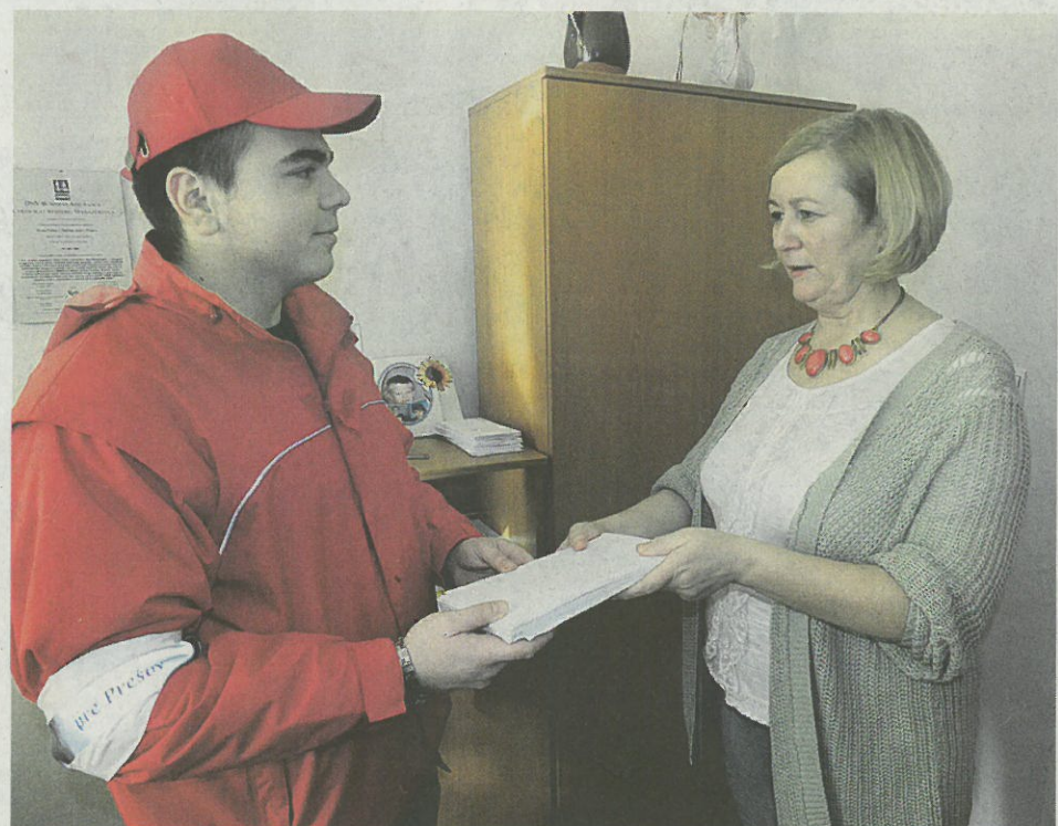
Z novej kuriérskej služby sú obyvatelia Prešova neraz prekvapení.