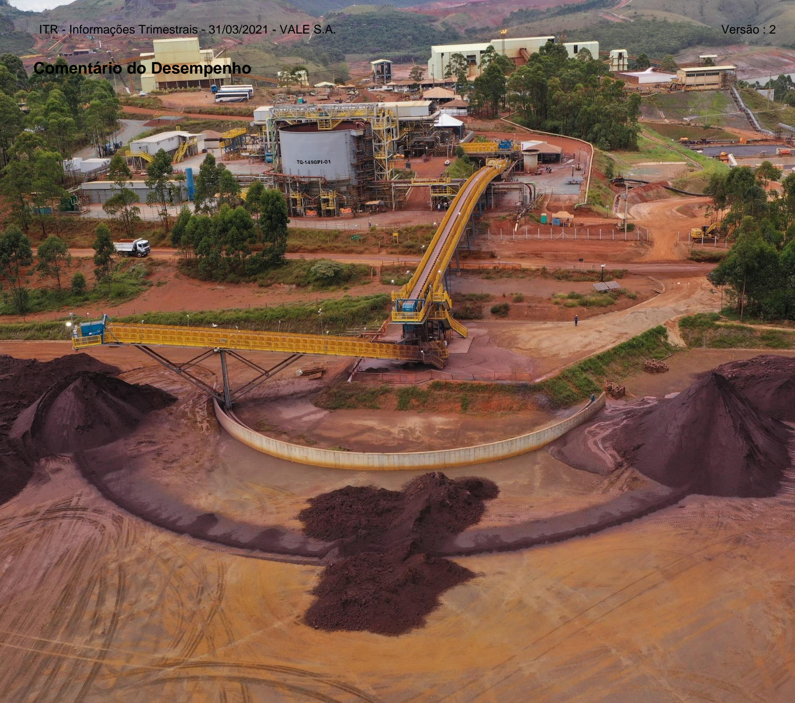
Planta de filtragem de rejeitos no complexo de Vargem Grande, entregue em março de 2021