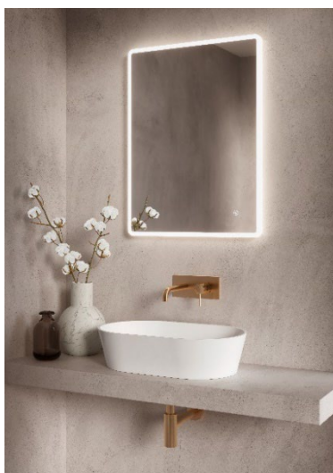
Mora INXX II inbyggd tvättställsblandare i borstad mässing.