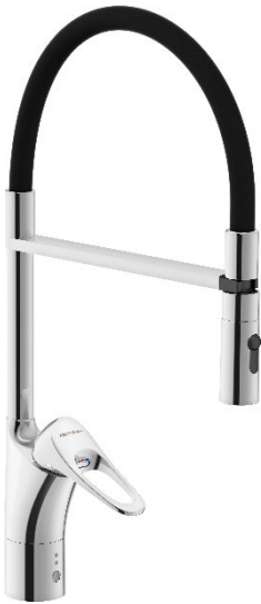
FM Mattsson 9000XE köksblandare.

Nettoomsättningen i moderbolaget uppgick till 732,9 Mkr (697,1), varav export av varor utgjorde 142,6 Mkr (143,2). EBITA uppgick till 62,5 Mkr (46,6) under perioden. Under perioden har elstöd om 7,6 Mkr erhållits. Perioden har också belastats med