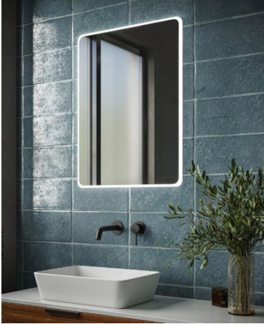
Aqualla Linea spegel.