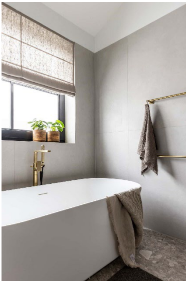
Hotbath Gal badkarsblandare.