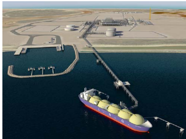
DEME - Wheatstone project Australië

Van Laere (AvH 100%) kon in het eerste kwartaal een mooie omzetstijging realiseren en haar orderportefeuille op peil houden in een erg competitieve markt. Van Laere zet de ontwikkeling van Alfa Park verder, haar dochterbedrijf actief in het beheer van parkings.