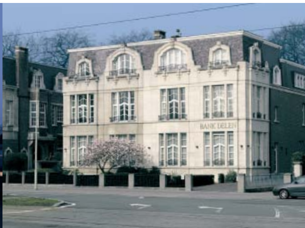
Delen Private Bank