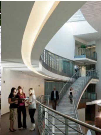
Leasinvest Real Estate - The Crescent