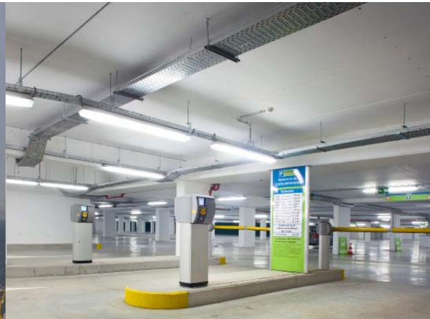
Algemene Aannemingen Van Laere