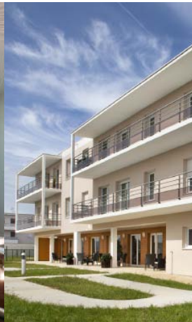
Groupe Financière Duval