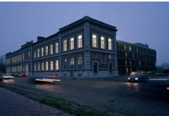
Bank J.Van Breda & C°