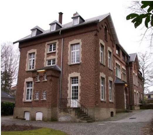
Anima Care - Parc des Princes

Anima Care (AvH 100%) verwierf eind januari het woonzorgcentrum Résidence Parc des Princes te Oudergem (49 bedden). Inclusief deze acquisitie exploiteert Anima Care momenteel 434 rusthuisbedden en 38 serviceflats, verspreid over 7 residenties.