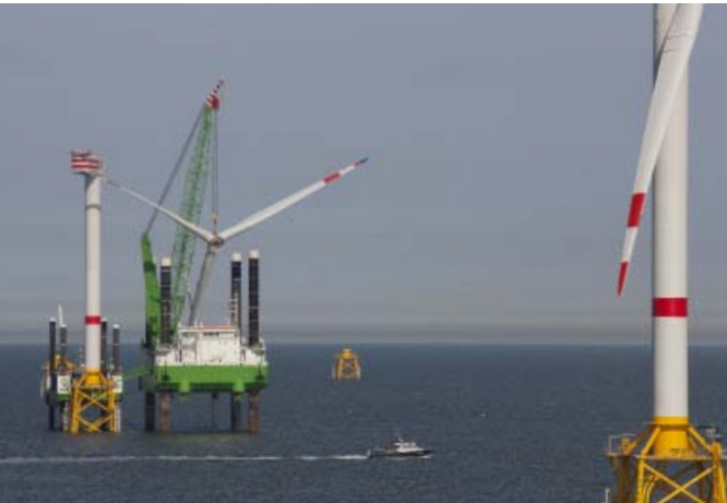
DEME - Neptune