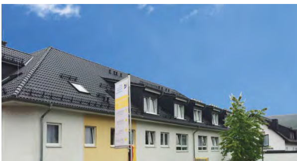
Senioreneinrichtung Haus Matthäus