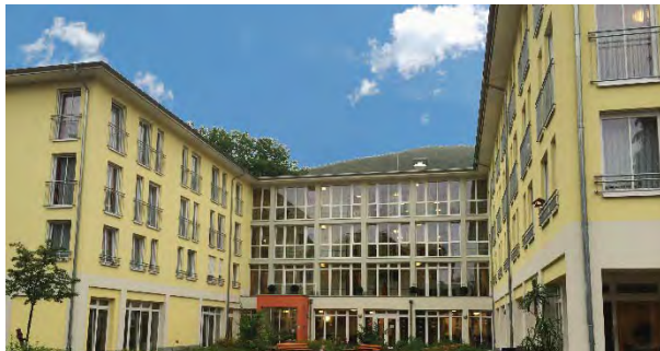
Seniorenresidenz Am Stübchenbach

16 décembre 2014 – après clôture des marchés Sous embargo jusqu'à 17h40