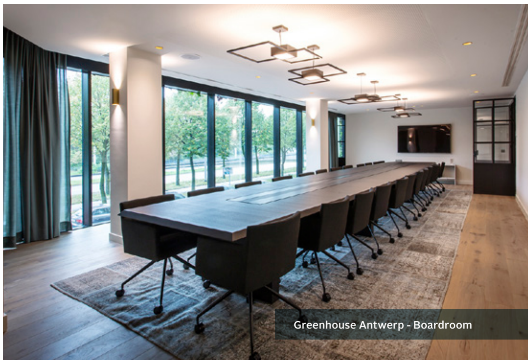
Greenhouse Antwerp - Boardroom

Au cas où le quorum nécessaire n'est pas atteint lors de l'assemblée générale extraordinaire une deuxième assemblée générale extraordinaire aura lieu le lundi 18 mai 2020 à 10h00 au siège d'Intervest pour délibérer de l'ordre du jour et des propositions de résolution.