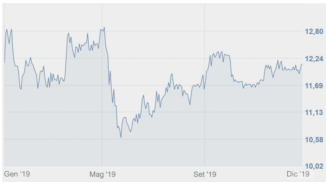
Andamento titolo AdB (01/01/2019-31/12/2019)

Alla data del 30 dicembre scorso, ultimo giorno di contrattazioni per Borsa Italiana nel 2019, si riscontra una quotazione ufficiale pari ad Euro 12,12 per azione, che porta a tale data la capitalizzazione di Borsa del Gruppo AdB a circa Euro 438 milioni.