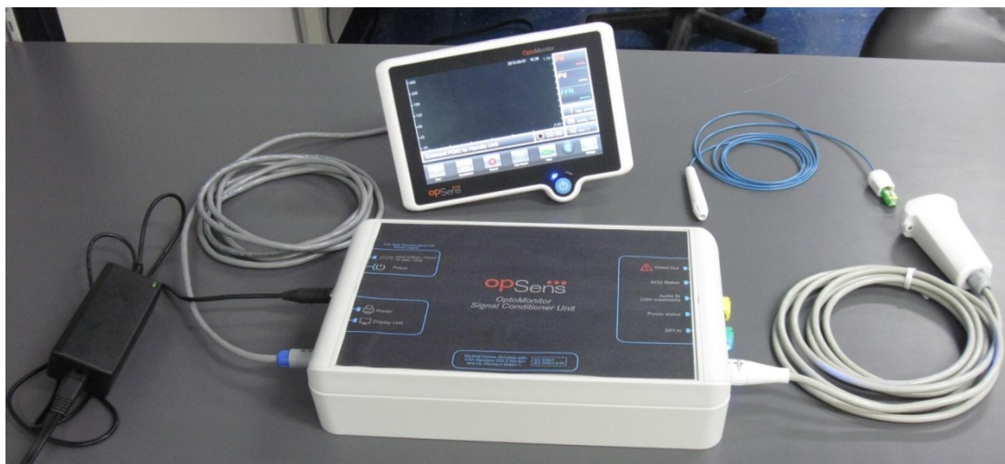
Figure 1 – OptoWire et OptoMonitor

La Société dessert aussi le marché industriel. La technologie, l'expertise et les produits d'Opsens peuvent servir plusieurs marchés, dont l'aérospatiale, la géotechnique, les infrastructures, le pétrole et gaz, l'exploitation minière, les laboratoires et d'autres. La sécurité inhérente des capteurs à fibre optique d'Opsens alliée à leur robustesse en font un choix attrayant pour ces applications. Le large portefeuille de produits et de technologies d'Opsens peut être adapté pour mesurer divers paramètres dans des conditions difficiles et fournir des avantages significatifs en termes d'optimisation de la production et de réduction des risques pour l'environnement et la santé.