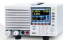
GEL-3031E 可程式直流電子負載 Programmable D.C. Electronic Load