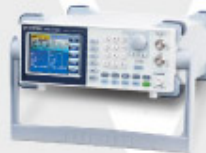
AFG-2225 任意函數信號產生器 Arbitrary Function Generator