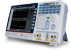
GSP-9330 3.25GHz 頻譜分析儀 3.25GHz Spectrum Analyzer