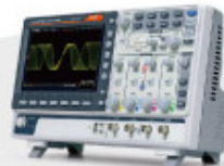
GDS-2000E Series 數位儲存示波器 Digital Storage Oscilloscope