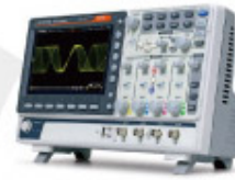
GDS-2000E Series 數位儲存示波器 Digital Storage Oscilloscope