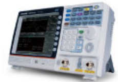
GSP-9330 3.25GHz 頻譜分析儀 3.25GHz Spectrum Analyzer