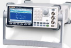
AFG-3000 Series 任意函數信號產生器 Arbitrary Function Generator