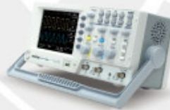
GDS-1000-U Series 可攜式數位儲存示波器 Digital Storage Oscilloscope