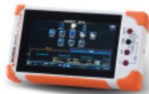
GDS-300/200 Series 數位儲存示波器 Digital Storage Oscilloscope