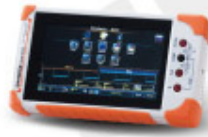
GDS-300/200 Series 數位儲存示波器 Digital Storage Oscilloscope