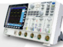
GDS-3000 Series 數位儲存示波器 Digital Storage Oscilloscope