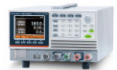
PSB-1000 Series 可程式直流電源供應器 Multi-range D.C. Power Supply