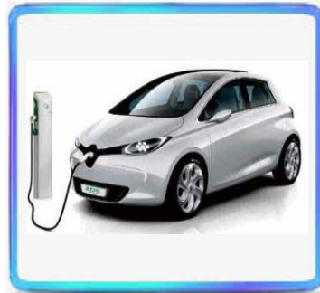
Car tronics BMS/CSC/AC