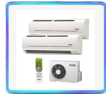
Air conditioner Drive/Control Board