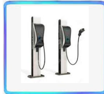
Household Charging pile