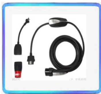
Portable Charging pile