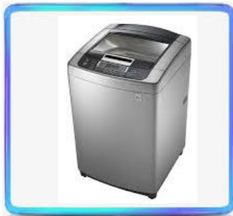
Washing machine BLDC motor Drive Board