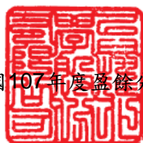
民國107年度盈餘分派表

(三)上表股東現金股利配發俟 108 年股東常會通過後，授權董事長另訂配息基準日及發放日等相關事宜。