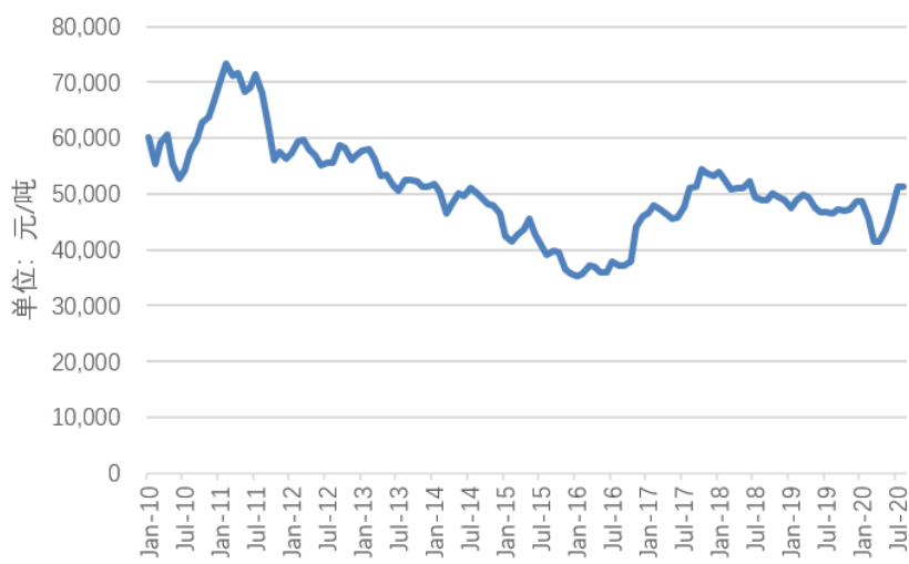
图2 金属铜价格走势

从长期来看,2011年前后铜金属价格达到近十年的最高价格,此后开始一路下跌,2016年跌至近十年的最低价格,此后开始反弹,2018年价格上涨至50000元/金属吨的上方,然后开始小幅震荡,2020年上半年价格下探至42000元/金属吨。经统计计算,评估基准日前十年一期平均不含税价格为43633.90元/金属吨,五年一期平均不含税价格为39191.16元/金属吨,三年一期平均不含税价格为42173.01元/金属吨。