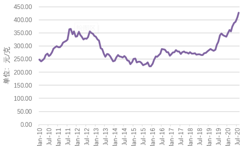
图3 黄金市场价格走势图

根据“上海黄金交易所”的统计数据，黄金2010年平均价格268.48元/克，2011年平均价格329.19元/克，2012年平均价格341.75元/克，2013年平均价格282.24元/克，2014年平均价格252.57元/克，2015年平均价格236.09元/克，2016年平均价格265.34元/克，2017年平均价格277.92元/克，2018年平均价格273.92元/克，2019年平均价格314.59元/克，2020年1~8月平均价格384.20元/克，黄金的近十年一期市场价格价格走势详见图3。