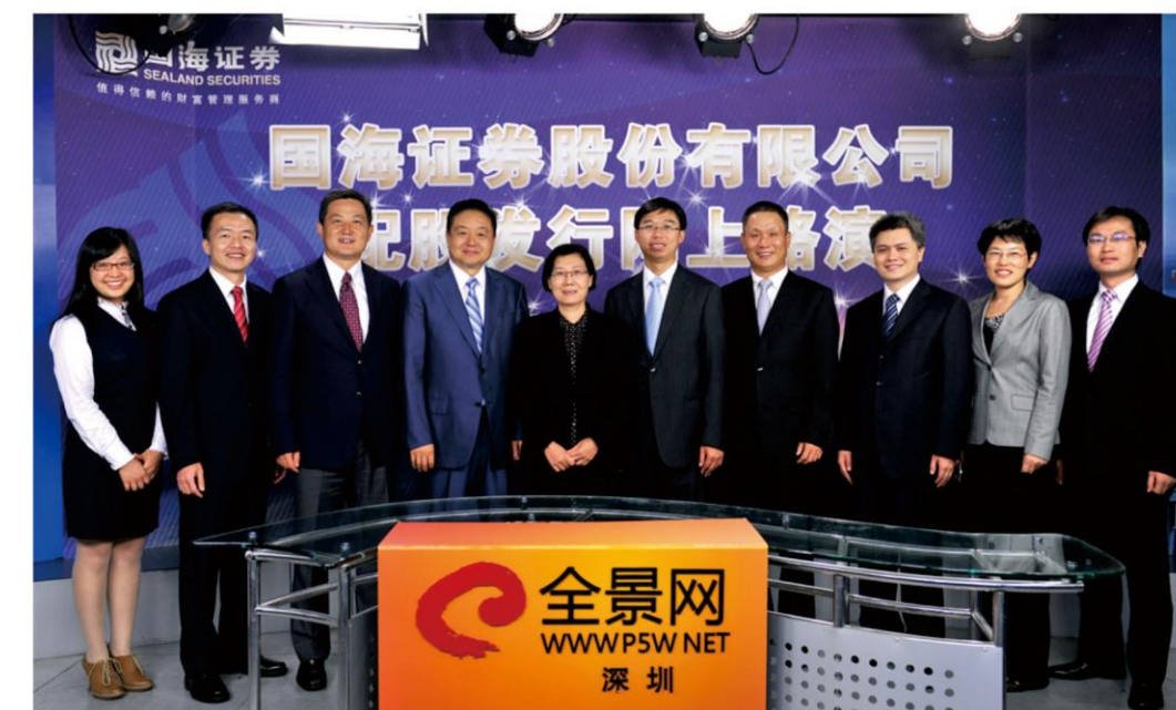
2013年11月14日，公司举行配股发行网上路演。

2013年，公司与时俱进修订了公司发展战略规划，实施集中突破的创新策略，加快创新发展进程，各项创新业务发展势头良好。按照“有所为，有所不为”的差异化发展策略，一方面公司对能有效发挥券商主导作用的业务（如两融业务），在做好风险控制的前提下，尽量满足客户需求，另一方面对于业务模式与制度环境尚未明朗的业务提前做好布局，加强论证研究，把握推进节奏。2013年，为保障公司创新转型和长远健康发展，公司圆满完成配股，从市场上成功募集资金32.56亿元，突破了净资本瓶颈，为公司创新转型和长远发展奠定了坚实基础。对于配股所募集资金，公司将从战略布局上综合考量，兼顾股东的长中短期利益，管好用好募集资金，回报股东。