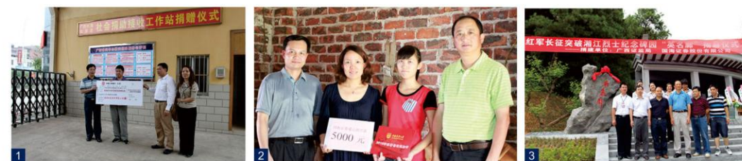
图1：公司通过广西民政厅社会捐助接收工作站向四川雅安地震灾区捐款。

2013年8月，公司积极响应广西区党委、政府的号召，投身到“美丽广西·清洁乡村”活动中，向广西武宣县思灵乡、武宣县禄新乡、忻城县厂上村捐资15.62万元用于开展清洁乡村的各项工作。