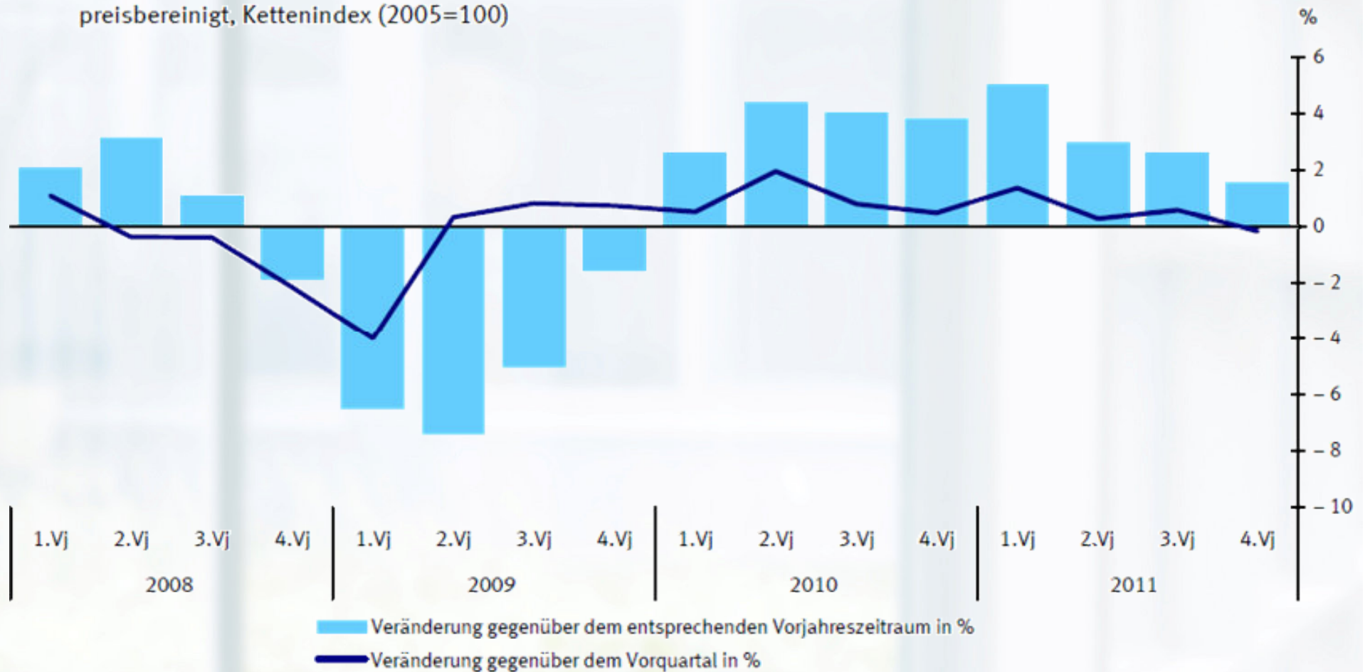
Entwicklung des Bruttoinlandsprodukts preisbereinigt, Kettenindex (2005=100)