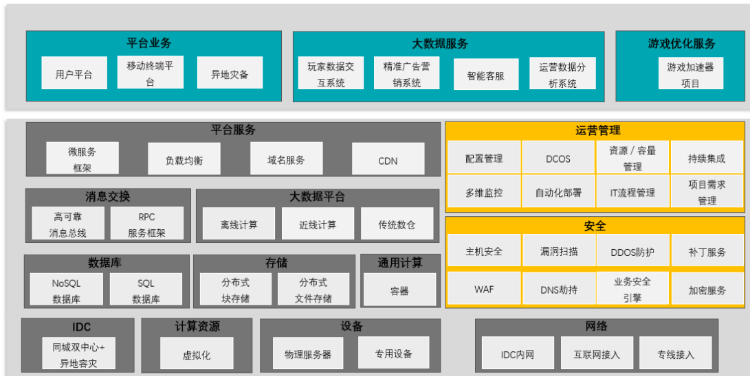
网络游戏运营平台架构图

除上述游戏综合运营平台的建设升级外，为进一步提升公司敏感核心运营数据的安全性，本项目拟搭建小型机房，从而更好的满足公司对主机、存储设备等 IT 设备的管理要求，同时，为公司敏感核心运营数据的安全提供更有力的保障。