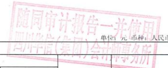
合并所有者权益变动表（续） 2015年度