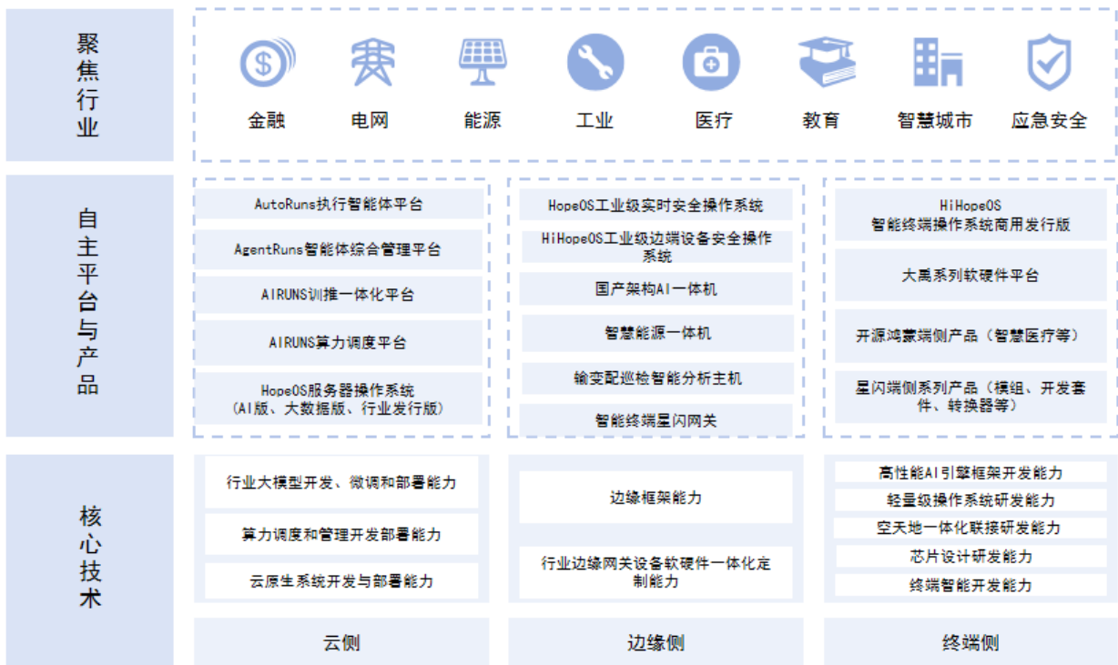
润和软件智能物联业务架构图

智能化： 在操作系统优势基础上提出“All in AI”战略，以操作系统为核心构建 AI 全栈技术及服务能力，基于昇腾为代表的国产算力，提供覆盖操作系统、AI 平台、大模型的 AI 一体化解决方案和工程化服务。提供包括软硬一体化产品、平台产品、大模型产品及工程化服务，并基于此全面助力行业客户智能化场景快速落地与业务创新升级，实现 AI 智能体的业务应用行业领先。