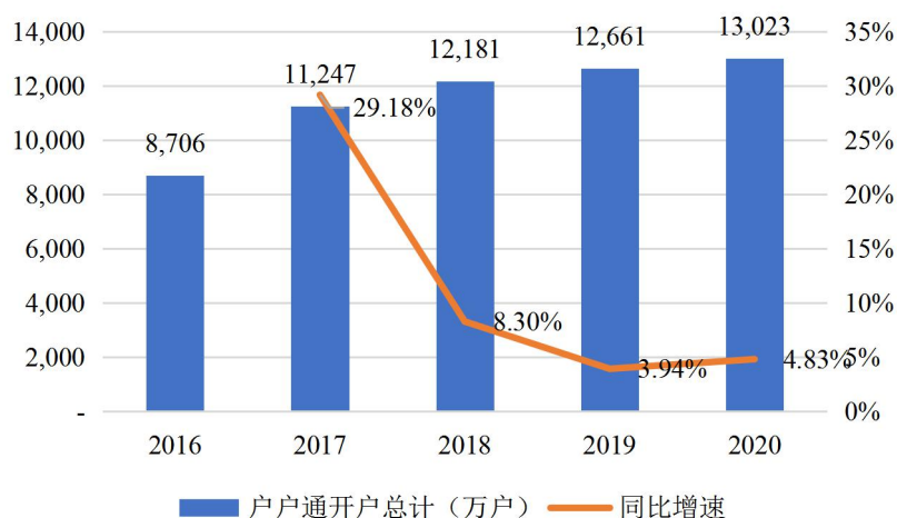
全国户户通开户情况

根据国家广电总局每月发布的户户通开户统计数据，受第四代直播卫星机顶盒更新换代政策预期影响，2018年全国户户通开户增速明显放缓，直播卫星机顶盒生产厂家减少了户户通第三代直播卫星机顶盒的产量，从而减少对直播星标清系列芯片的采购量，与公司2018年前募广播芯片销量不及预期的情况相匹配。