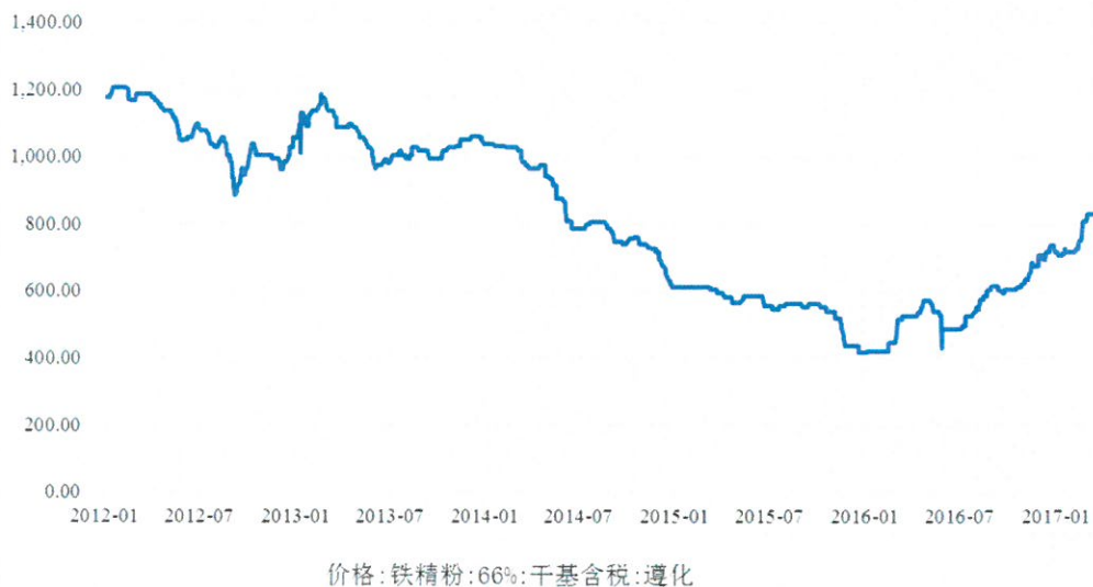
图表 2. 近年来我国铁矿石价格走势情况 (元/吨)

据中钢协统计数据显示，2016 年重点钢铁企业实现销售收入 28,022 亿元，同比下降 1.81%；利润总额为 303.78 亿元，同比实现扭亏为盈；会员钢铁企业的亏损面和亏损额均大幅下降。2016 年，会员钢铁企业销售成本同比下降 6.25%，期间费用同比下降 1.67%。2016 年，会员钢铁企业销售利润率只有 1.08%，虽然比 2015 年明显改善，但仍处于工业行业较低水平。