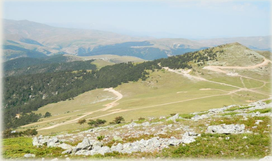
Konak Projesi; Kızılyar Tepe'ye Korukbeli Tepe'den Bakış

Mayıs ayında başlayan sondaj çalışmalarına halen 2 kuyuda devam etmekte olup, toplamda 10 kuyu tamamlanmıştır. Ay sonu itibariyle toplamda 8055.10m. ilerleme sağlanmıştır. Sondajlardan alınan 3729 örnek laboratuvara gönderilmiştir. Ayrıca 8 kuyudan alınan 3696 terraspec örneğinin okumaları tamamlanmıştır.