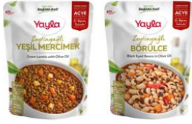
Zeytinyağlı Sebze Yemekleri