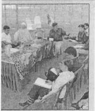
कांग्रेस सूत्रों के अनुसार, श्री कमलनाथ ने कहा कि प्रधानमंत्री भ्रष्टाचार की दीमक को मारने के लिये नोटबंदी लाने की बात करते हैं. यह सही है और नोटबंदी के समय प्रचारित भी यही किया गया था, लेकिन इस दवाई से भ्रष्टाचार की दीमक तो नहीं, लेकिन इससे 100 से अधिक निर्दोष आम नागरिक जरूर मारे गये।