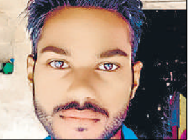
राजा की फाइल फोटो।