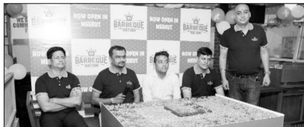
रेस्टोरेंट की लांचिंग के अवसर पर मेरठ यूनिट के अधिकारी।

अ.हि.ब्यूरो/मवाना। भारत ही नहीं, बल्कि पूरे विश्व में लजीज व्यंजनों की दुनिया में अपनी पहचान बना चुका बारबेक्यू नेशन रेस्टोरेंट का आउटलेट अब मेरठ में भी खुल गया है। कंपनी के अधिकारियों ने नगर में चल रही शहीद चंद्रभान प्रदर्शनों में स्टॉल लगाकर आगतुकों को रेस्टोरेंट की जानकारी दी। इसमें वेज व नॉन वेज के लजीज व्यंजन ग्राहकों को परोसे जाएंगे। इस संबंध में जानकारी देते हुए कंपनी