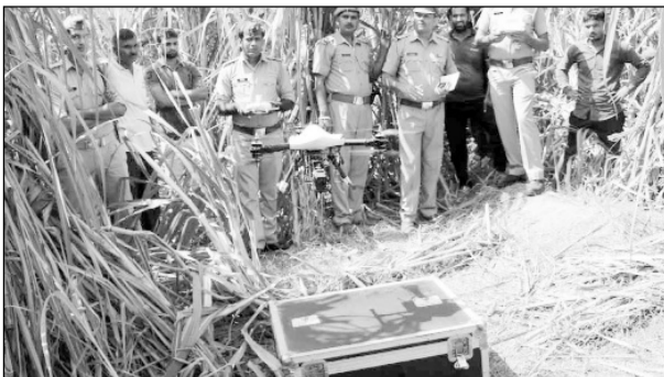
घटना के बाद मौके स्थल पर जांच करने पहुंचे पुलिस अधिकारी