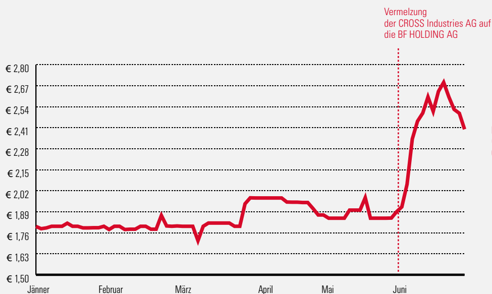
Kursentwicklung CROSS Industries-Aktie 01.01.2015 - 30.06.2015