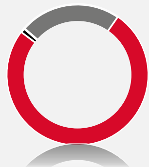
Aktionärsstruktur zum 30.06.2015

Die Aktie der CROSS Industries AG zeigte im ersten Halbjahr 2015 eine sehr erfreuliche Entwicklung. Die Aktie schloss am ersten Handelstag des Geschäftsjahres 2015 (zu diesem Zeitpunkt noch BF HOLDING AG) bei € 1,80 und stieg bis zur Verschmelzung am 2. Juni 2015 auf € 1,89. Seit der Verschmelzung stieg die CROSS Industries-Aktie kontinuierlich und schloss am Stichtag 30.06.2015 mit € 2,40. Der höchste Schlusskurs im ersten Halbjahr lag bei € 2,69; der niedrigste bei € 1,71. Die Marktkapitalisierung bei 225.386.742 zum Handel zugelassenen Aktien betrug per 30.06.2015 540,93 m€.