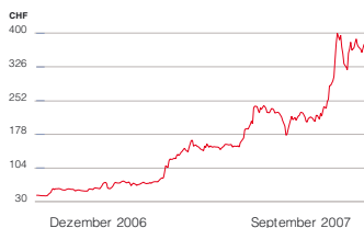
Meyer Burger Technology Aktienkurs

Börsenentwicklung. Der Aktienkurs stieg weiter kontinuierlich von CHF 82.00 per Ende März auf CHF 163.00 per Ende Juni 2007. Nach Bekanntgabe des oben erwähnten Grossauftrages Anfang Juli erhöhte sich der Kurs nochmals markant. Per 28. September 2007 betrug der Kurs CHF 235, rund 187% höher als Ende März. Nach dem Stichtag des Halbjahresberichtes stieg der Kurs zwischenzeitlich bis über CHF 400. New Value hat die hohe Nachfrage nach Meyer Burger Aktien für Gewinnrealisationen genutzt und verkaufte in der Berichtsperiode 12'000 Aktien zu einem durchschnittlichen Preis von CHF 162.32. New Value hatte die Aktien von Meyer Burger während des IPO im November 2006 für CHF 39.00 erworben. Die Beteiligungsquote lag per 30. September 2007 bei 0.3%.