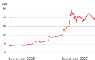
3S Swiss Solar Systems Aktienkurs

Börsenentwicklung. Der Aktienkurs der 3S erhöhte sich von CHF 8.20 per Ende März um 176% auf CHF 22.65 per 28. September 2007. Dieser Schlusskurs entspricht dem Wert der 3S-Beteiligung im NAV von New Value am Stichtag. New Value nutzte die hohe Nachfrage nach 3S-Titeln für Gewinnmitnahmen. In der Berichtsperiode wurden insgesamt 376'699 Aktien zu durchschnittlich CHF 19.48 verkauft und 26'000 Aktien zu durchschnittlich CHF 18.45 gekauft. Die Beteiligungsquote lag per 30. September 2007 bei 26.9%.