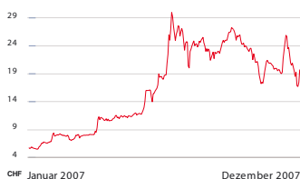
3S Swiss Solar Systems Aktienkurs

Börsenentwicklung. Der Aktienkurs der 3S erhöhte sich von CHF 22.65 per Ende September bis Mitte Oktober auf das Jahreshöchst von CHF 27.30. Danach fiel der Kurs im Zuge der allgemeinen Marktverunsicherung auf ein Tiefst von CHF 17.20. Gegen Ende des Jahres zog die Aktie wieder an und schloss bei CHF 21.75. Damit blickt 3S auf ein phänomenales Börsenjahr mit einer Kurssteigerung von 275% zurück. New Value nutzte die hohe Nachfrage nach 3S-Titeln für Gewinnmitnahmen. In der Berichtsperiode wurden insgesamt 136 913 Aktien zu durchschnittlich CHF 24.83 verkauft und 74 650 Aktien zu durchschnittlich CHF 18.73 gekauft. Nach Stichtag verkaufte New Value weitere 20 500 Aktien zu durchschnittlich CHF 26.00.