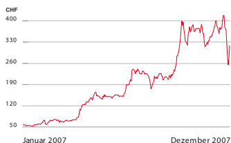
Meyer Burger Technology Aktienkurs