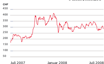
Meyer Burger Technology Aktienkurs