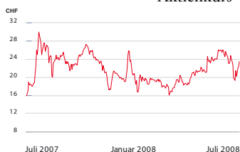
3S Swiss Industries AG Aktienkurs

Der Aktienkurs reagierte positiv auf die Veröffentlichung des Geschäftsergebnisses und die Übernahmeankündigung von Somont und erhöhte sich in der Berichtsperiode kontinuierlich. Der Schlusskurs am 30. Juni 2008 betrug CHF 24.50, rund 32% höher als Ende März.